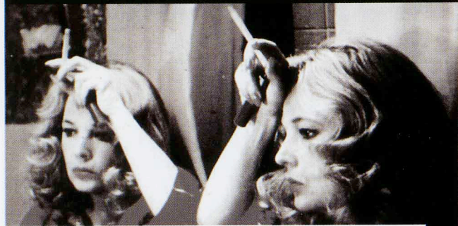
Μία γυναίκα εξομολογείται (A WOMAN UNDER THE INFLUENCE, ΗΠΑ 1974)