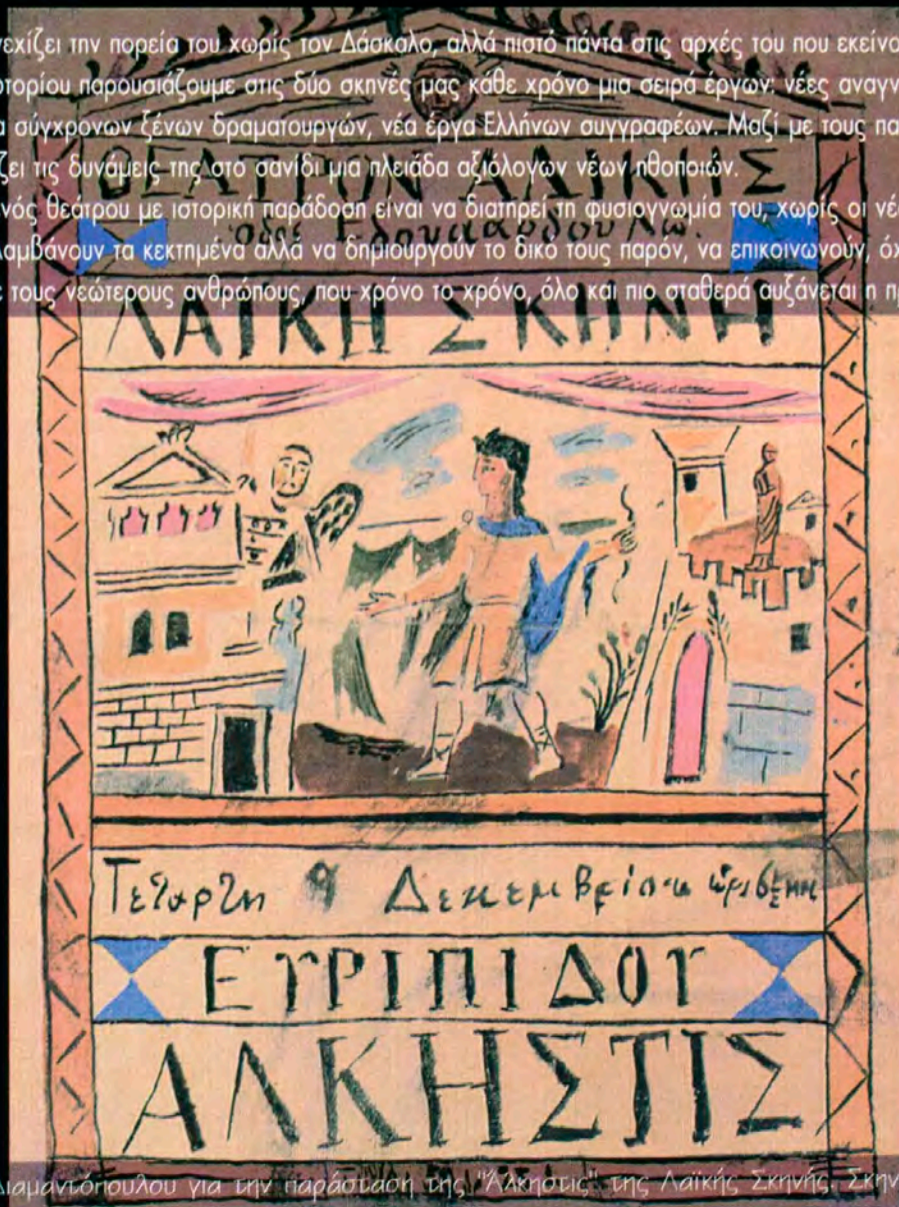
Αφίσα του Δ. Διαμαντόπουλου για την παράσταση της "Άλκπστις" της Λαϊκής Σκηνής. Σκηνοθεσία Κ. ΚΟΥΝ

Και βέβαια ο βασικότερος στόχος ενός θεάτρου με ιστορική παράδοση είναι να διατηρεί τη φυσιογνωμία του, χωρίς οι νέοι άνθρωποι, που το αποτελούν σήμερα και κάθε σήμερα, να επαναλαμβάνουν τα κεκτημένα αλλά να δημιουργούν το δικό τους παρόν, να επικοινωνούν, όχι μόνο μ' εκείνο το κοινό, που ποτέ δεν μας αρνήθηκε, αλλά και με τους νεώτερους ανθρώπους, που χρόνο το χρόνο, όλο και πιο σταθερά αυξάνεται η προσέλευσή τους στο θέατρο Τέχνης.